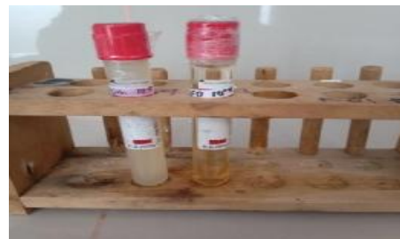
Gambar 1. Hasil produksi enzim amilase (Larutan Enzim Kasar)